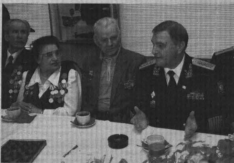
Застольная беседа главкома с ветеранами.

Приятно, что среди 15 ветеранов-моряков Мурманской области, удостоившихся столь вы-