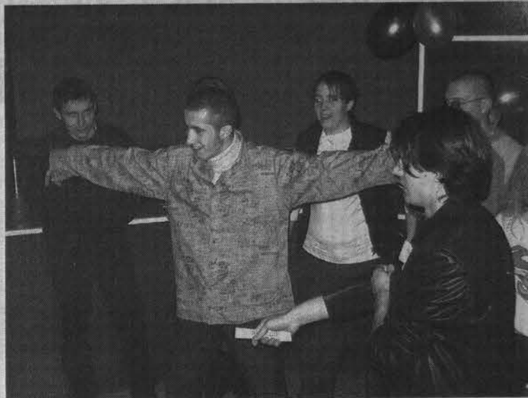
Творческие способности пришлось проявлять не только девушкам.

Цветы, подарки, внимание прессы и само осознание победы, стало отличным окончанием ожидания. Как при-