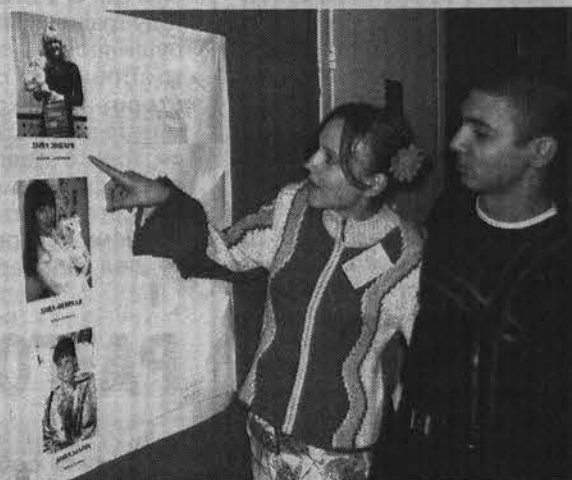
Стенд с фотографиями привлекал всеобщее внимание.