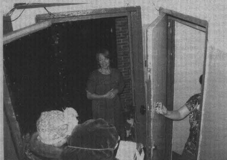
Иногда аудитория увеличивалась вдвое.