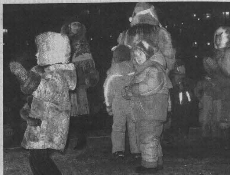
Самыми активными участниками были дети.