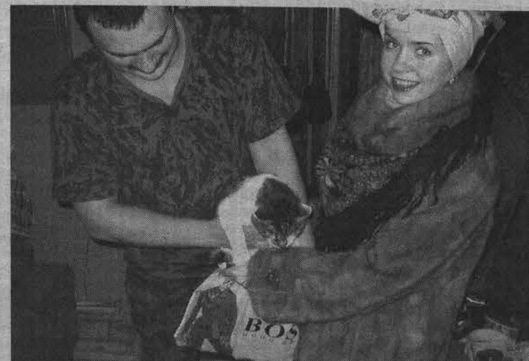
Отдай мою рыбку!