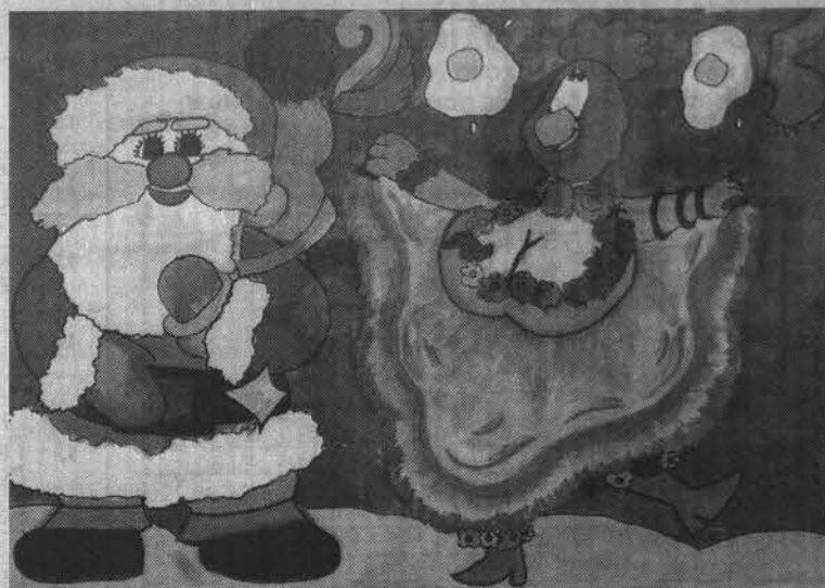
Рисунок Кристины Жабиной, 13 лет.

Каждый победитель стал обладателем специально изготовленной для конкурса медали, эксклюзивного настенного календаря с фотографией именно его