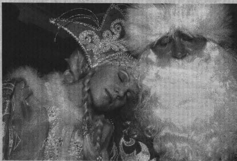
Ох, и трудная это работа - быть Дедом Морозом и Снегурочкой.

Александр ПАНЮШКИН.