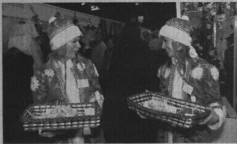
Снегурочки из ОАО «Хлебопек» предлагают всем желающим вкусную и полезную продукцию.

Декабрь – месяц подведения итогов года уходящего. Прошедший 2006 стал удачным для североморского молочного завода. Его продукция – кефир однопроцентный «Латона» – стал лауреатом выставки «Сто лучших товаров Мурманской области». На федеральном уровне, в Москве, североморский кефир вошел в программу «Сто лучших товаров России» и получил диплом.