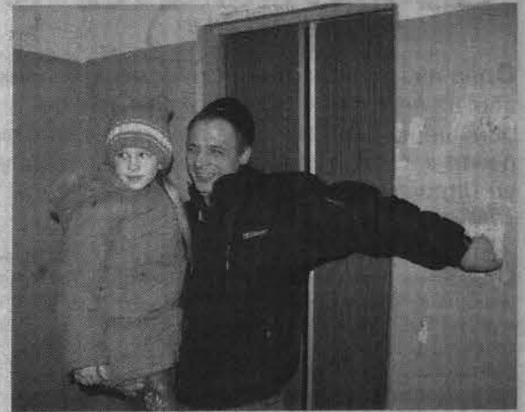
Лучше своих двоих может быть только работающий лифт.

Как будет действовать новое соглашение и измененная система расчетов, покажет время. Будем надеяться, что североморские лифты действительно будут останавливаться только с целью обновления и усовершенство-