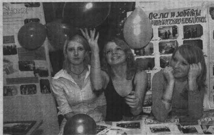
Инициативные девушки из «Поиска» легки на подъем.