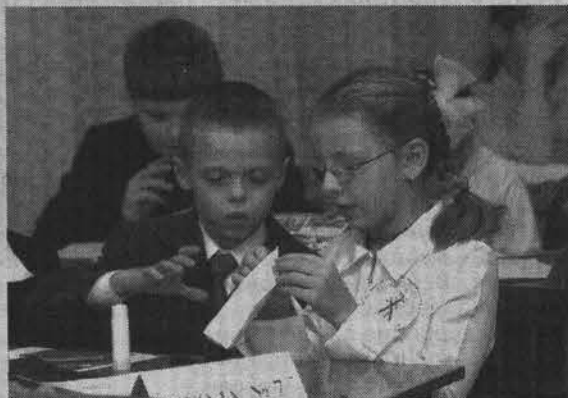
Корабль из бумаги изготовить не составит нам труда.

Соревнования проходили в три этапа. На первом юные техники представили свои команды. Многие подошли к этому творчески и рассказали о себе в стихах. На втором этапе команды продемонстрировали теоретические знания в области технического моделирования, выполнив тестовые задания. С этим испытанием почти все ребята справились отлично. На последнем этапе каждый член команды выполнял отдельное задание: один решал логические задачи, другой делал по чертежу модель кораблика, третий защищал поделку, коллективно созданную в качестве домашнего задания. Самым сложным испытанием было выполнение модели по чертежу, ведь жюри, в состав которого вошли пе-