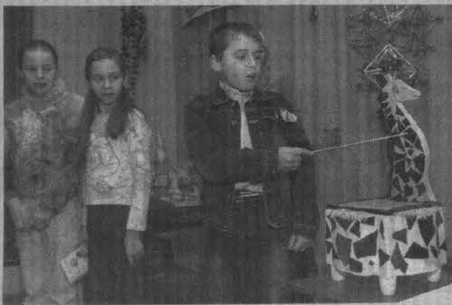
Стул-жираф для куклы смастерили дружно.