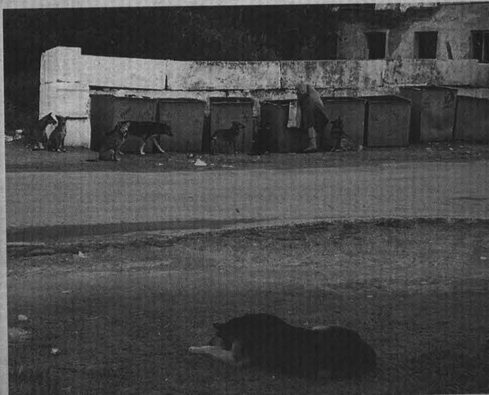
Кто знает, что на уме у этих собак?