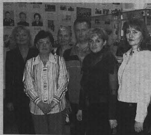
Специалисты Центра занятости рассказали о своей работе на открытии выставки.

За 15 лет существования Североморского центра занятости его услугами воспользовались около 30 тысяч человек. При содействии