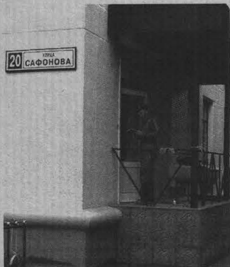
Из-за этого новостроя и разгорелся сыр-бор.