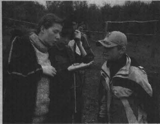
Сориентироваться на незнакомой местности для этих ребят уже не составит труда.

Но северная природа внесла свои коррективы в эту походную идиллию - в ночь с 4 на 5 июля ураганный ветер и проливной дождь стали настоящей проверкой ребят на смелость и выдержку. Все вместе боролись со стихией: закрепляли палатки, спасали от дождя и ветра инвентарь, поддерживали огонь. Утром 5 июля при непрекращающемся ливне было принято решение лагерь свернуть.