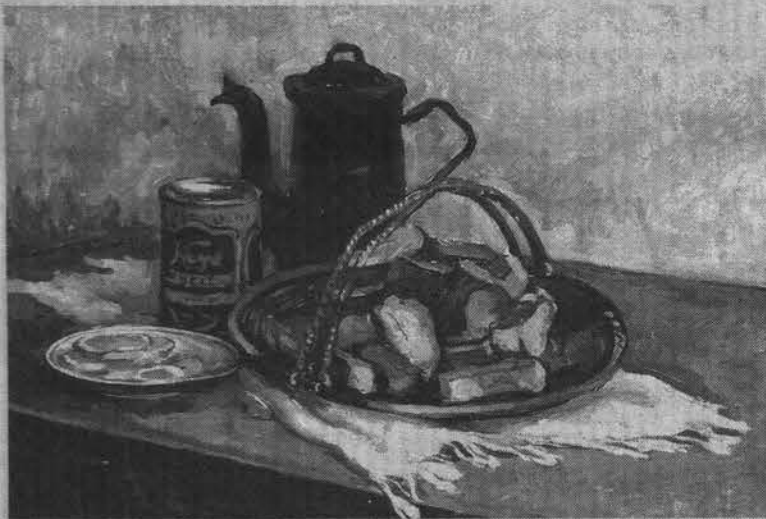
Сретенский Г.А. «Натюрморт с кофейником». 1961 год.