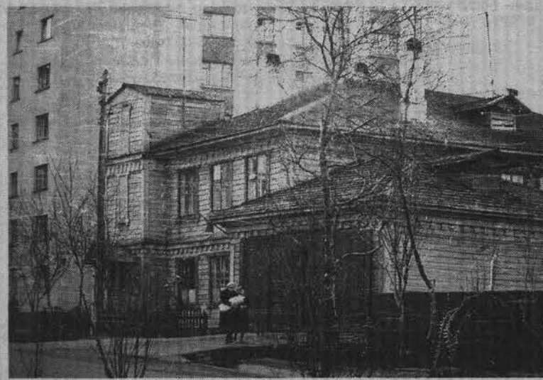
Пожарная часть на улице Головки. Конец 50-х.