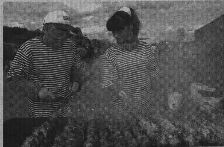
Шашлык летом уходит влёт, и не только в дни народных гуляний.