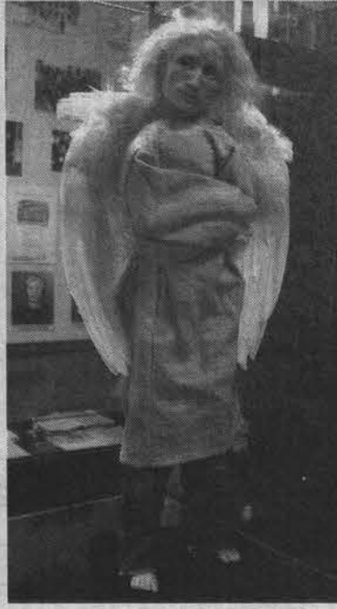
Чудаковатый ангел: руки связаны, но крылья-то целы.