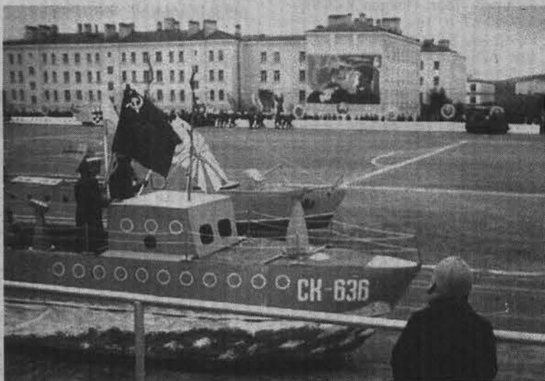
Празднование Дня ВМФ на стадионе.

Елена ЯКУНИНА. Фото из архива музея Дома творчества.