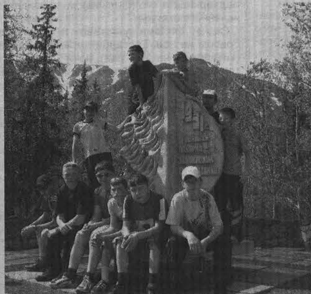
Участники велопробега у входа в Полярно-альпийский ботанический сад.

И уже в это воскресенье, 25 июня, состоится вторая летняя велогонка в гору от администрации до остановки Северная Застава. Желающие принять участие регистрируются до 25 июня по адресу: ул. Душенова, 11, вход со двора, или по телефону: 5-01-48. Велогонка стартует в 12.00, к участникам просьба подойти к 11.00 в велоклуб для получения номера и внесения в протокол. В этот раз вводится дополнительная зачетная номинация для спортсменов на горных велосипедах.