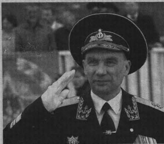
Вице-адмирал Владимир Высоцкий.

В скором времени на базе Северного флота состоятся специальные мероприя-