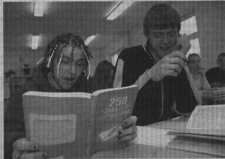
11 «Б» готовится к экзамену.