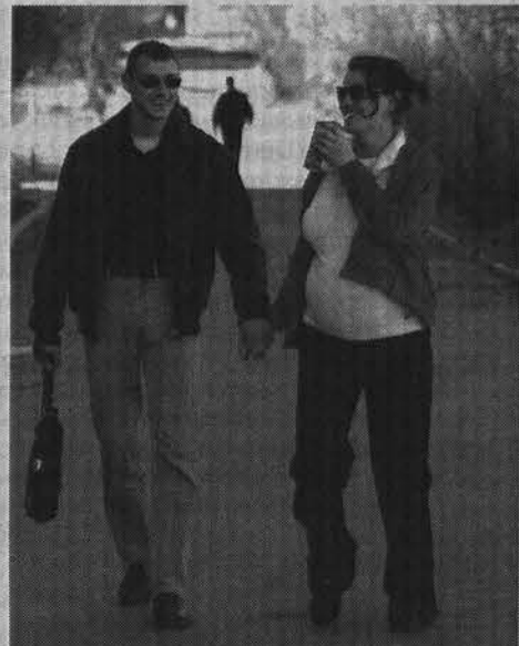
Общение с близким человеком - это всегда приятно.

Надеюсь, каждый из вас, прочитав эти нехитрые советы, найдет что-то для себя и скажет «да, я с этим согласен» или «в