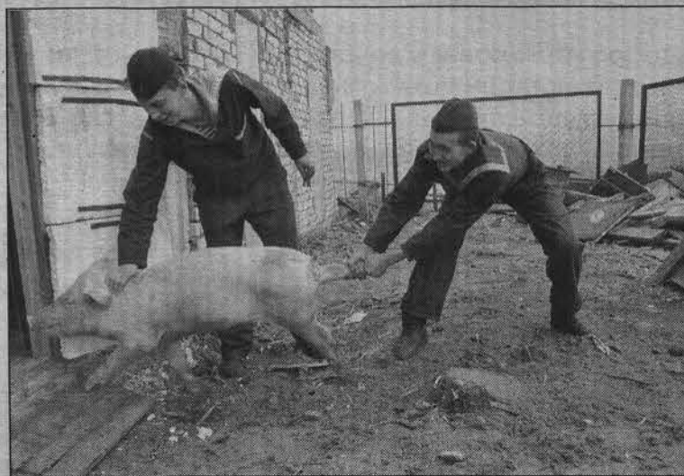
Все равно всех посчитают.

Проводить перепись будут более 225 тыс. человек – уполномоченные по вопросам переписи, регистраторы, переписчики, инструкторы, координаторы. Переписчики набираются преимущественно из числа жителей пере-