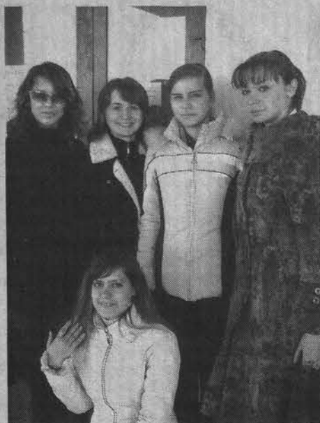
Один экзамен с плеч долой!

- Сначала переволновалась так, что ответила почти на все вопросы теста по химии неправильно, хорошо потом перепроверила, исправила. Пользоваться можно было таблицей Менделеева, таблицей растворимости и калькулятором. Мне обязательно надо «четверку» получить для поступления в Смоленский сельскохозяйственный институт