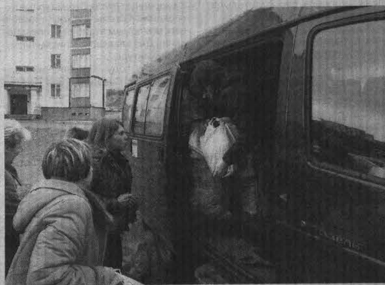
Жители ул.Сизова переживали: хватит ли в «Газели» места для собранных вещей.

Чтобы помочь людям, необязательно дожидаться следующего рейда. Можно самостоятельно принести вещи в КЦСОН. Одежду и обувь для взрослых лучше передавать в отделение срочной