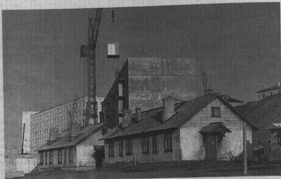
Последние финские дома на ул.Надгорной и строительство новой улицы, впоследствии названной именем Саши Ковалева. 1975-76г.г.