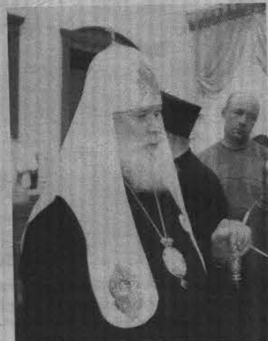
Алексий II позволил приколоть себе на рясу значок «Славянского хода».

В этом году «Славянский ход» проходил по Северо-Западу России,