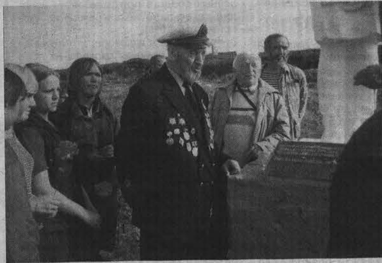
Вахта памяти - 2004. Митинг у обелиска Медицинской сестре (п-ов Рыбачий, Большое озерко).