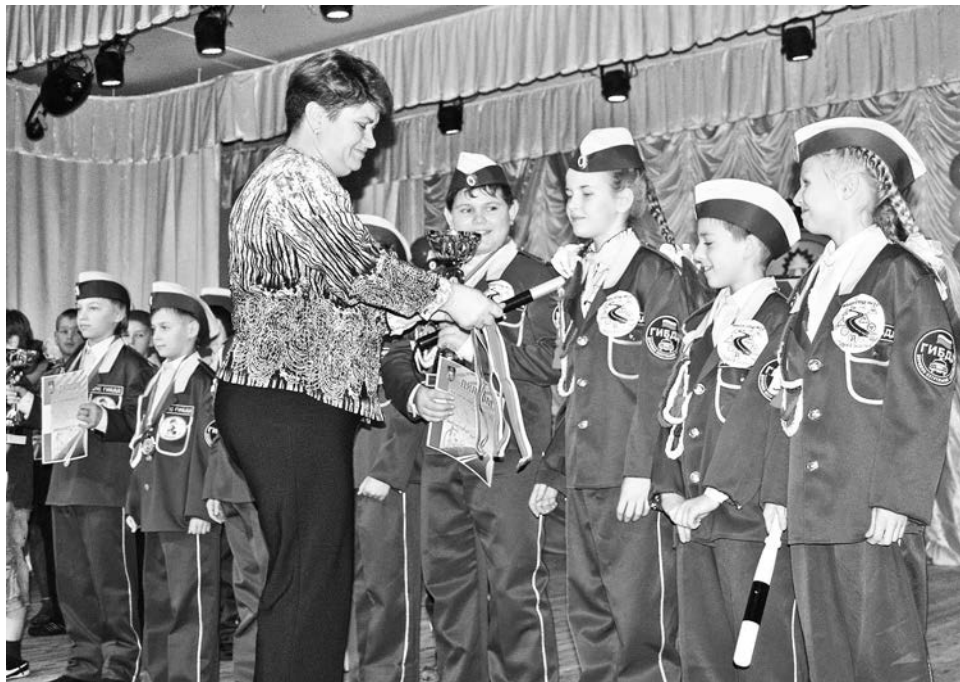
В зале победители радовались шумно, а на сцене принимали награды сдержанно и с достоинством.

В Доме детского творчества им.С.Ковалева прошел второй этап соревнований для школьников от 10 до 12 лет «Безопасное колесо».