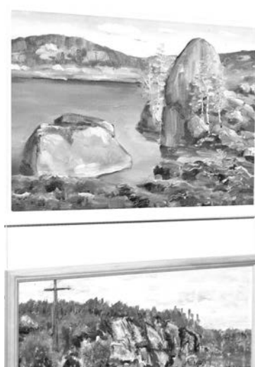
Марина Бродецкая представила на выставке свои первые работы с натуры.