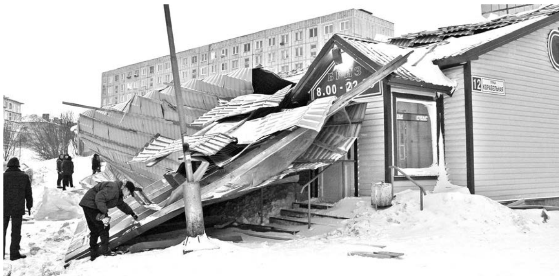
Сейчас крыша восстановлена - и магазин снова начал свою работу.

Никто из людей не пострадал, а вот припаркованному возле магазина автомобилю «Форд» досталось. Его владельца рассказала, что у «Бриза» она раньше оставляла машину нечасто, просто в этот вечер во дворе совсем не оказалось