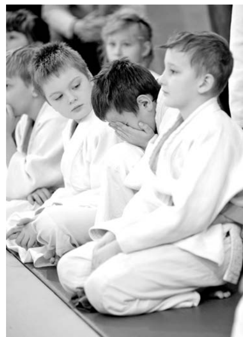
Радость победы и горечь поражения каждый переживает по-своему.