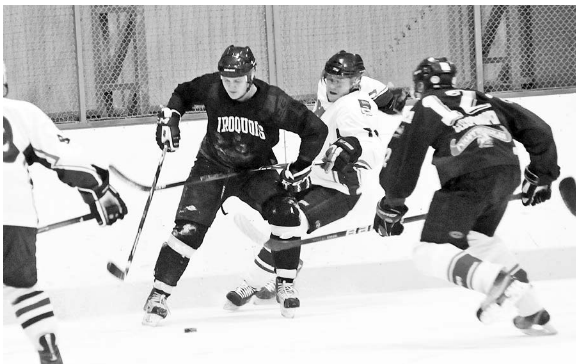
«Шторм» не боится ни метели, ни урагана и в чемпионате идет без потерь.

Календарь игр областного чемпионата для североморской хоккейной команды «Шторм» таков, что все выходные не дает передышки ни спортсменам, ни болельщикам: в субботу «Шторм» сыграл выездной матч, а в воскресенье вышел на домашний ледовый корт ДЮСШ-3.