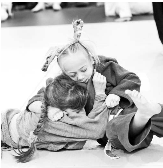
Таких боевых девчонок одноклассники за косички дергать опасаются.