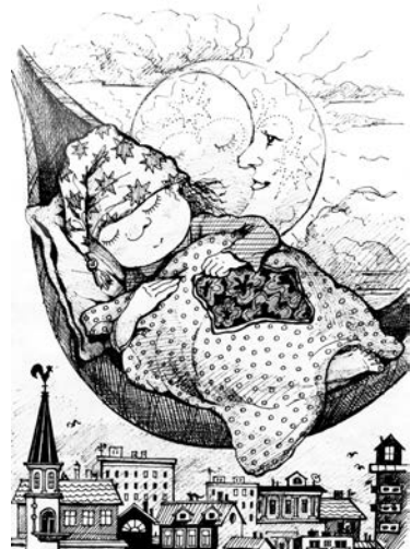
«Соннырики. Спокойной ночи».