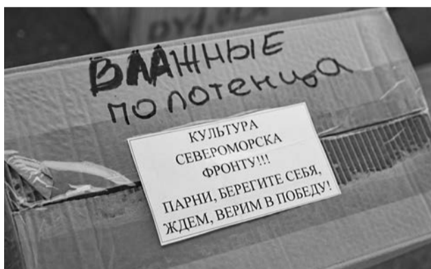
Не только помощь, но и моральная поддержка.

На этот раз на передовую будут доставлены маскировочные сети, антидроновые сети, сетка рабица, средства связи, газовые баллоны, раз-