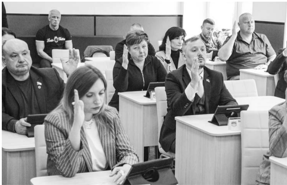
В принятии решений депутаты, как правило, демонстрировали завидное единодушие.

торый рассказал, в частности, об источниках финансирования: