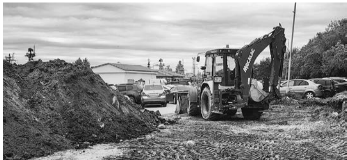
Ремонт в районе морвокзала ко Дню флота должен завершиться.