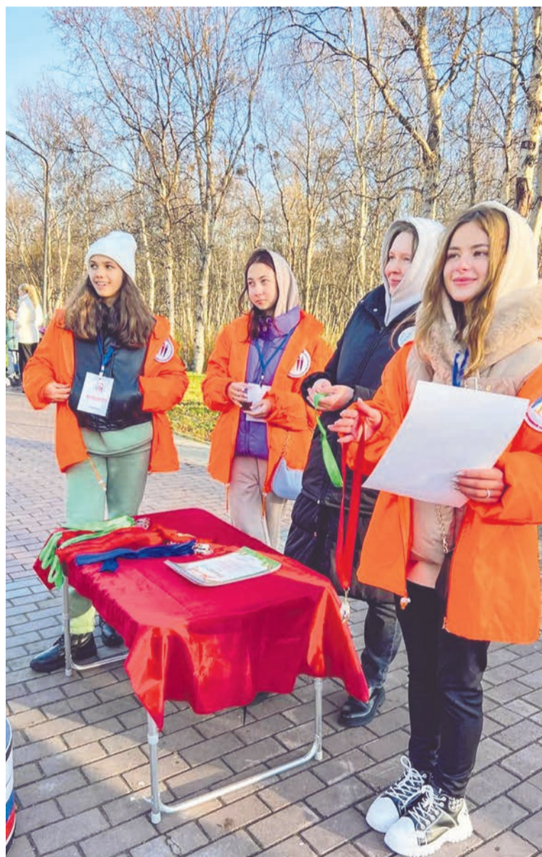
Молодые активисты обеспечивают проведение большинства городских спортивных мероприятий.

Фото из альбома волонтерского отряда «Добро на Севере».