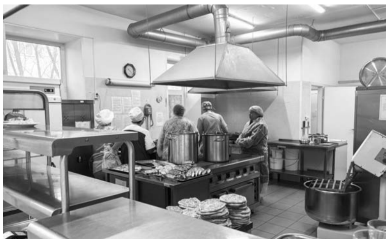
Пищеблок столовой школы №11 проходит тщательную проверку.