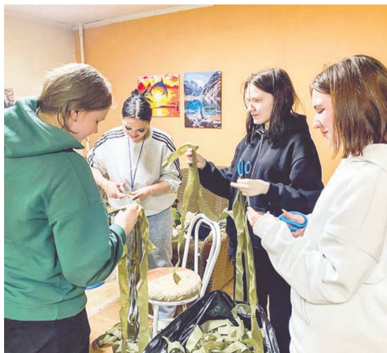
В перечне добрых дел молодых североморцев - регулярное плетение маскировочных сетей.