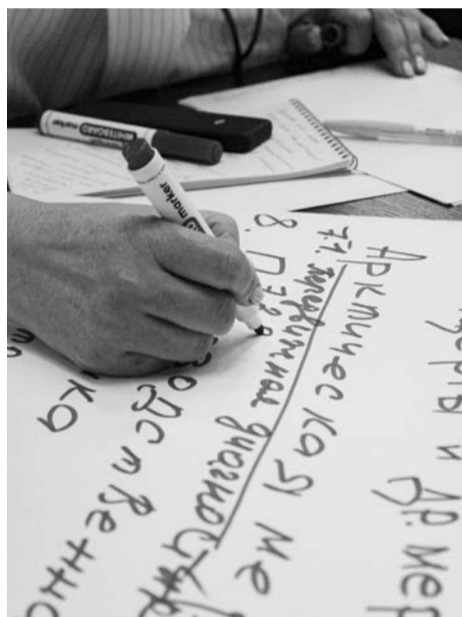
Совместный мозговой штурм оказался очень эффективным.