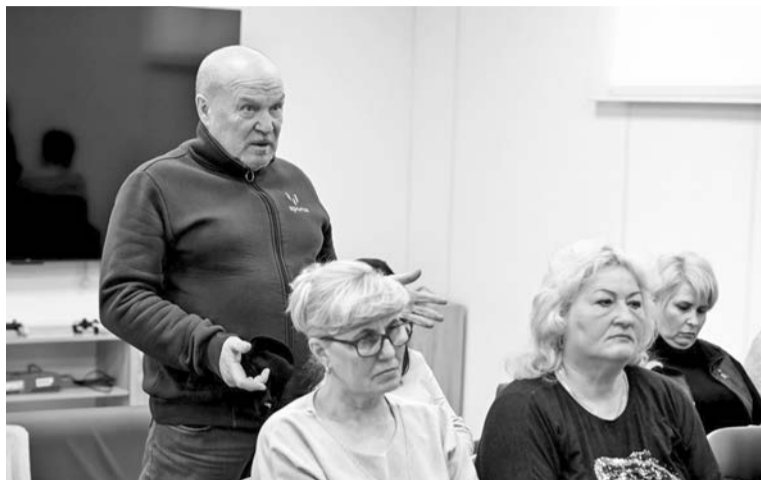
Один из вопросов, волнующих жителей Североморска-3, касался доступности телевидения.

же телевидение. Спросили жители и про демонтаж аварийного оборудования на детских площадках.