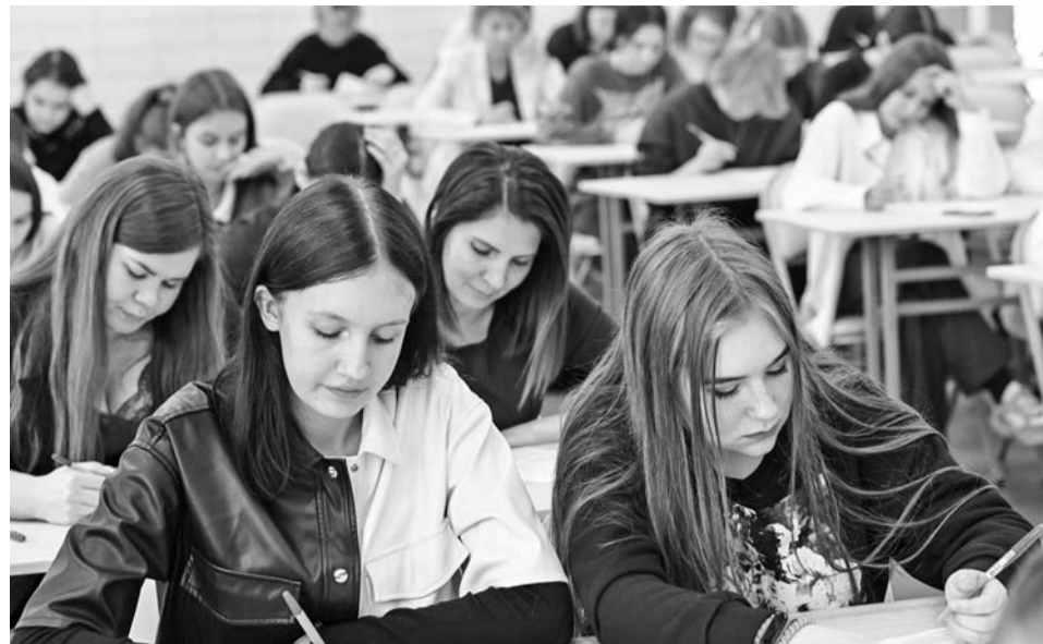
Перед тем как сесть на студенческую скамью, абитуриентов ждёт ответственный период приёмной кампании.

В Северноморске ярким подтверждением этого стало профориентационное мероприятие «Выбери себе профессию!», состоявшееся ещё в феврале. Тогда в лицей № 1 к девятиклассникам флотской столицы приехали представители ряда средних специальных учебных заведений. Перемещаясь между площадками образовательных учреждений, школьники обсуждали всё увиденное. Говорили, что многих заинтересовали такие направления обучения, как банковское дело, строительство и эксплуатация зданий и сооружений, поварское и кондитерское дело.