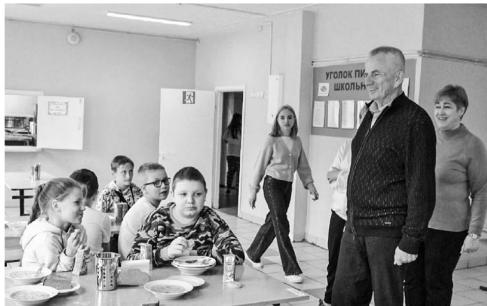
Дети охотно рассказали депутатам, как здорово прошла первая смена в лагере.