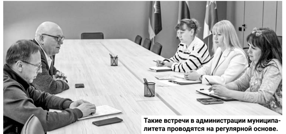
Такие встречи в администрации муниципалитета проводятся на регулярной основе.

Подготовила Анна ЛИПИНА.