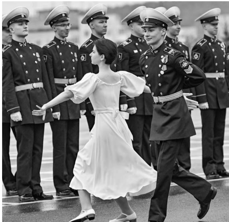
На строевом плацу училища выпускники вместе с участницами мурманских хореографических коллективов станцевали вальс.

— Годы успешной учёбы здесь открывают вам широкие пер-