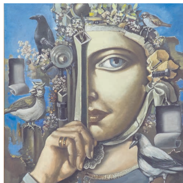
Иван Ворон (Североморск). «Метод Сократа». Холст, масло. 2015 г.

— Выставка насыщенная. Она и наводит на размышления, и вызывает улыбку, дарит весеннее настроение и чувство полета. Сказочные,