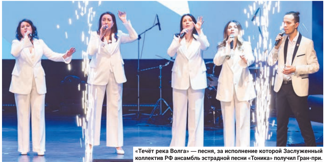
«Течёт река Волга» — песня, за исполнение которой Заслуженный коллектив РФ ансамбль эстрадной песни «Тоника» получил Гран-при.