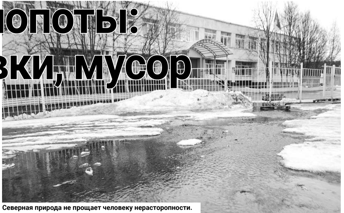
Северная природа не прощает человеку нерасторопности.