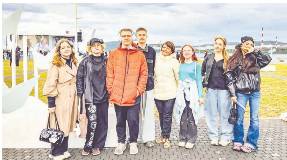
Выпускники и педагоги школы №11 «Арктический берег» запомнят надолго.

На Поморской набережной в Коле состоялся пятый фестиваль выпускников «Арктический берег».