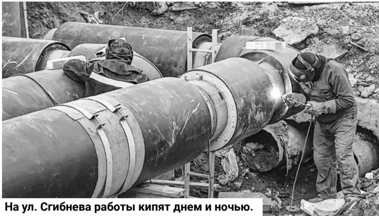
На ул. Сгибнева работы кипят днем и ночью.

минимум — дать жителям «9 микрорайона» воду к обещанному сроку — 20 июля, как максимум — ко Дню ВМФ также закрыть разрывы, восстановить дорогу и асфальтовое покрытие на ней.