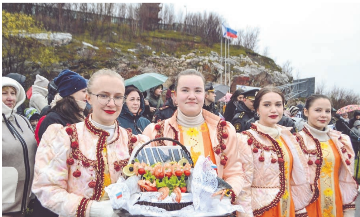
Волонтеры также не раз принимали участие в торжественной встрече кораблей Северного флота из дальних походов.