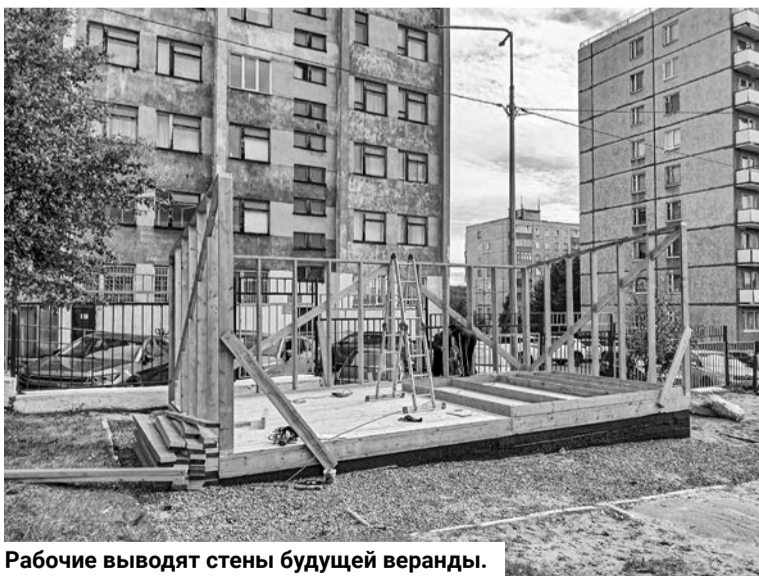
Рабочие выводят стены будущей веранды.

чие произвели настил пола, приступили к возведению стен беседки, а затем установят игровые элементы.