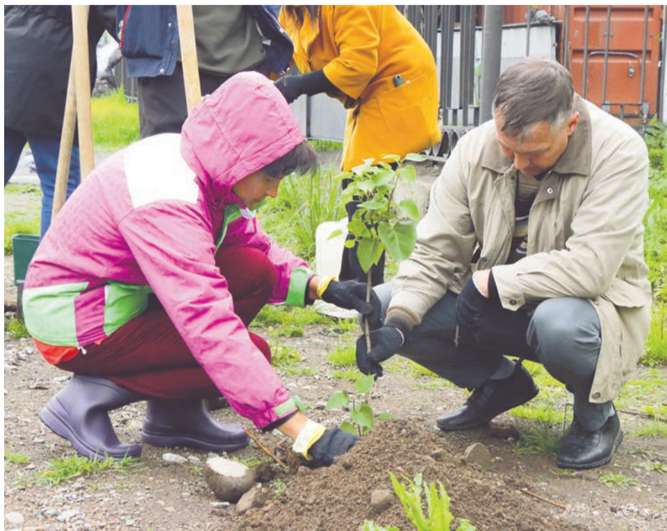
Деревца на этой аллее сажали с любовью и заботой.

— Давай-ка сюда нашу Ангелину. Вот так, аккуратно, ещё немного грунта — и теперь полить, — заботливо приговаривали участники проекта «Зелёный город», начиная высаживать сирень в районе прогулочной дорожки от храма Веры, Надежды, Любви и матери их Софии до главпочтамта. Причём каждому саженцу на этой аллее они дали имя.