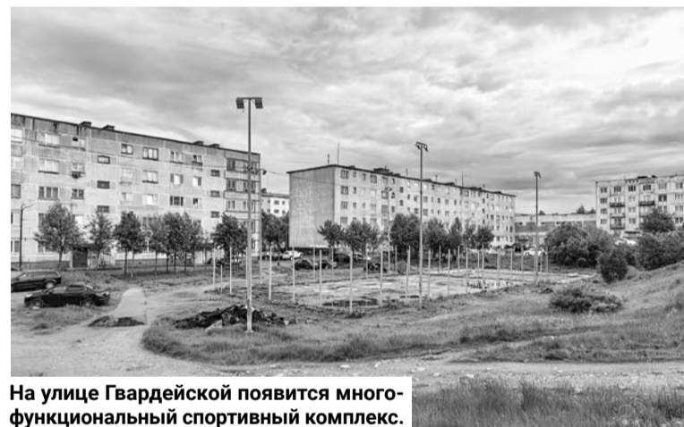
На улице Гвардейской появится многофункциональный спортивный комплекс.