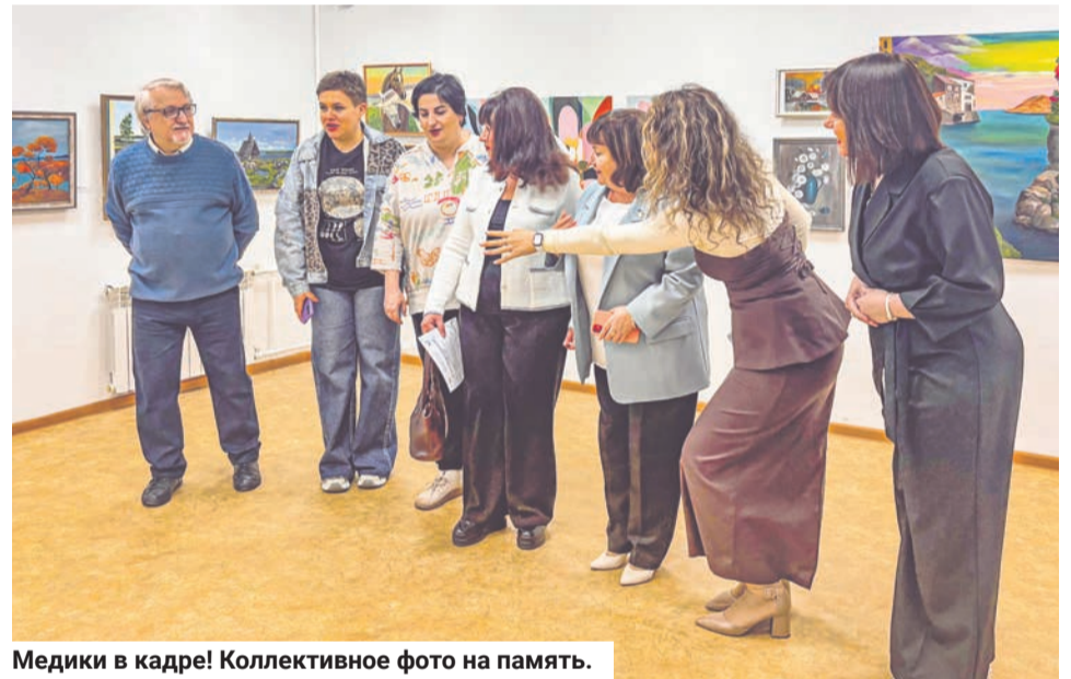
Медики в кадре! Коллективное фото на память.