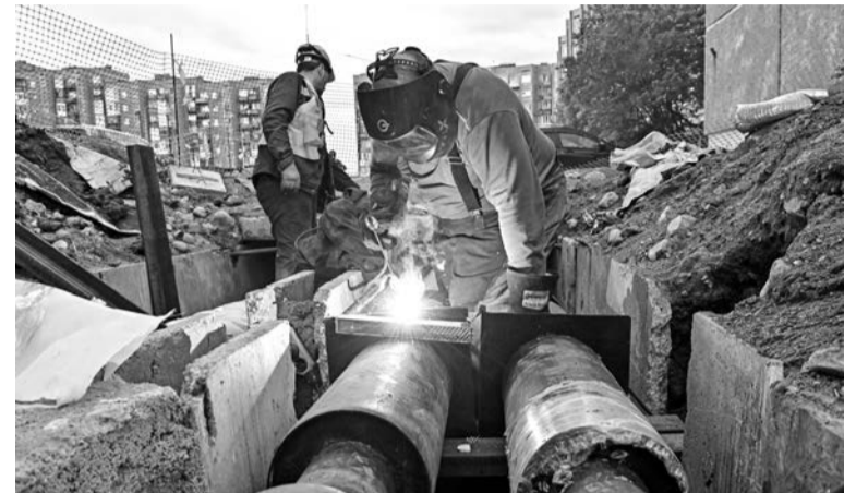
Ремонтные работы на сетях - один из самых актуальных вопросов этого лета.

— В вопросах, связанных с поддержкой самих участников спецоперации, помогает администрация города, военный комиссариат по ЗАТО Североморск и Островной, — отме-