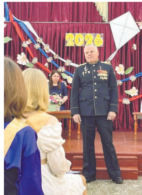
Герой России Александр Панасюк: «Только вперед!»