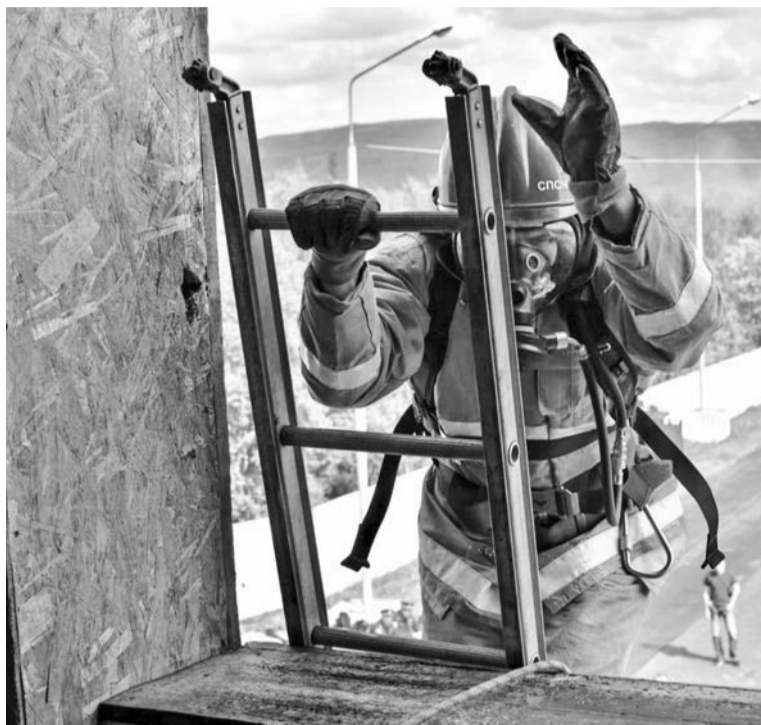
Соревнования огнеборцев всегда отличаются зрелищностью.