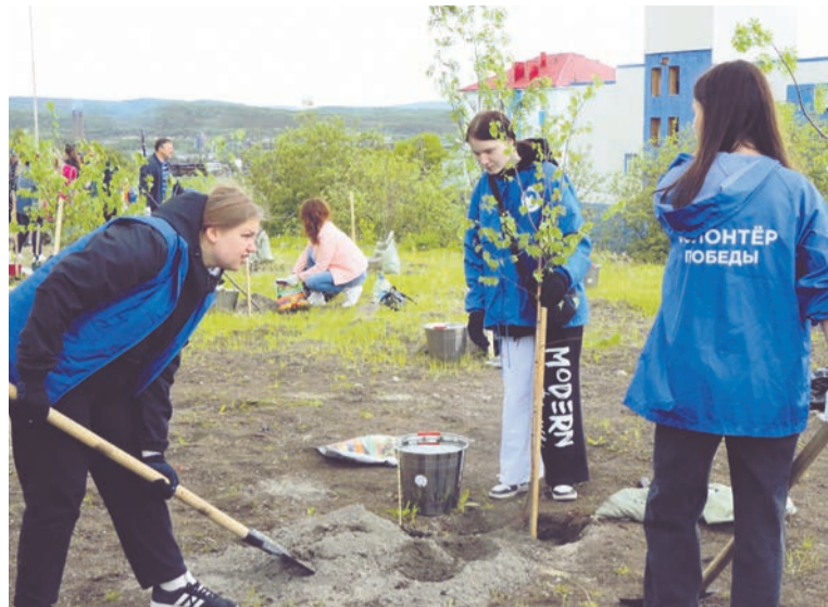
Участие в высадке деревьев в ходе акции «Сад Памяти».