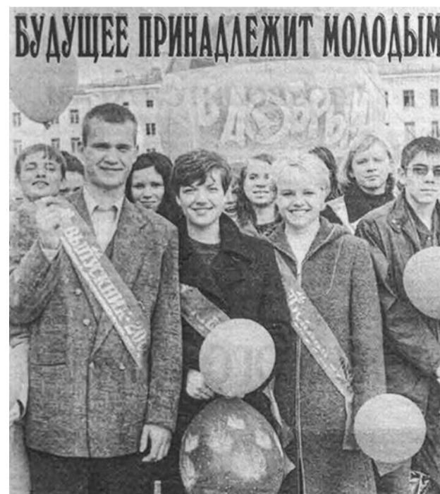
17 июня на Центральном стадионе Северного флота прошёл традиционный общегородской праздник «Выпускник-2001».