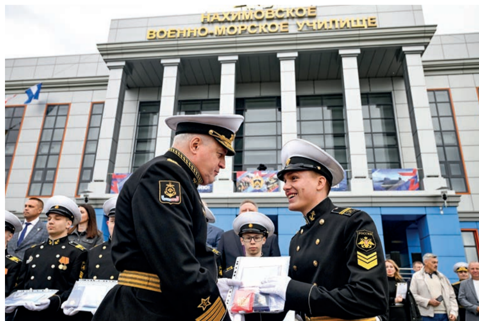
Адмирал Константин Кабанцов: «Профессия защитника Отечества и военная служба в России всегда были делом чести».

По информации пресс-службы СФ.