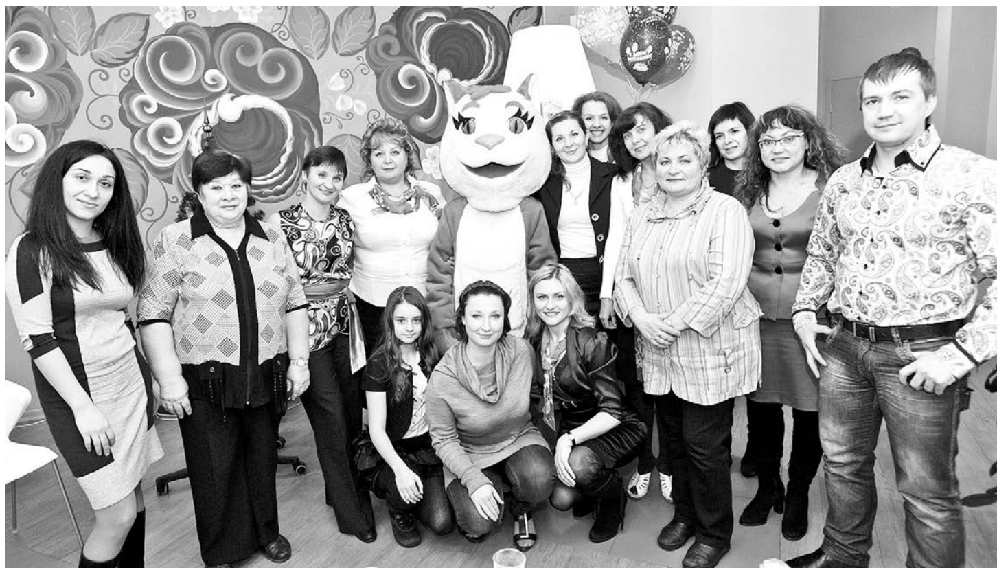
Коллектив Бюро финансовых решений «Пойдем!» и его символ - оранжевый Кот в кругу любимых клиентов.

морцев обилием банковских услуг не удивишь, а вот неказенное, человеческое отношение будет в новинку. Побеседовать с сотрудниками североморского офиса Бюро финансовых решений «Пойдем!» действительно приятно: вежливое обращение, доброжелательная улыбка, как будто за чашкой чая вы обсуждаете свои финансовые дела с хорошим другом, который посоветует, подскажет, найдет верное решение. Пока будет идти оформление документов, вас угостят чашечкой ароматного кофе, а если вы заглянули в «Пойдем!» с детьми - и им найдется занятие в детском уголке. Прямо при вас и с вашего разрешения консультант позвонит вашему работодателю для подтверждения вашей трудоустроенности - и практически на этом все прощери закончатся. От вас требуется только представить паспорт и еще один документ, удостоверяющий личность (водительские права, страховое свидетельство ПФ РФ, ИНН, пенсионное удостоверение, воинский билет, удостоверение личности офицера и т.д.).