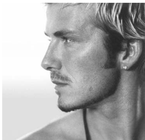
Успешный спортсмен, многодетный отец и, пожалуй, самый ухоженный мужчина Дэвид Бэкхем.

прочный и плотный верхний слой кожи, так что и косметическое средство требуется более сильное. Во-вторых, эпидермис мужской кожи состоит из продолговатых клеток, плотно прилегающих друг к другу, поэтому женские очищающие средства оказываются в этом случае неэффективными. Подкожные жировые отложения на муж-