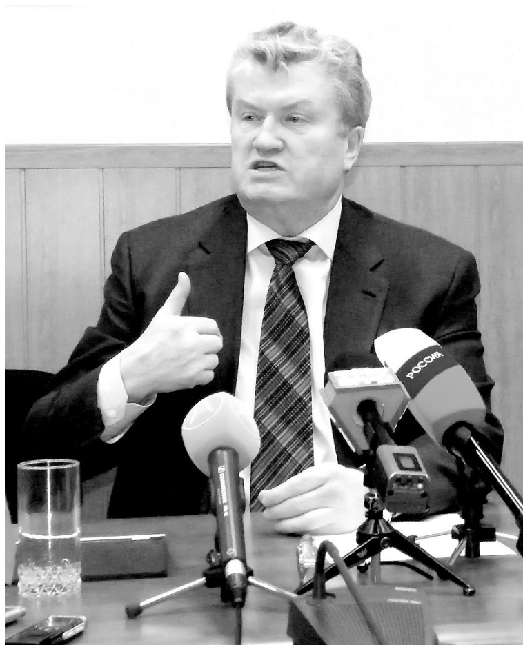
Депутат Госдумы Валерий Язев отчитался перед избирателями Мурманской области о работе за год.

По просьбе журналистов Валерий Язев прокомментировал принятый Государственной думой РФ Закон «О мерах воздействия на лиц, причастных к нарушениям основополагающих прав и свобод человека, прав и свобод граждан Российской Феде-