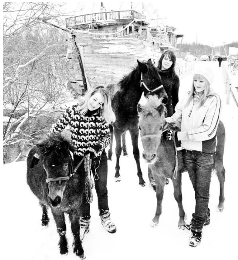
Воспоминания о них еще живы, но самих лошадок больше нет.