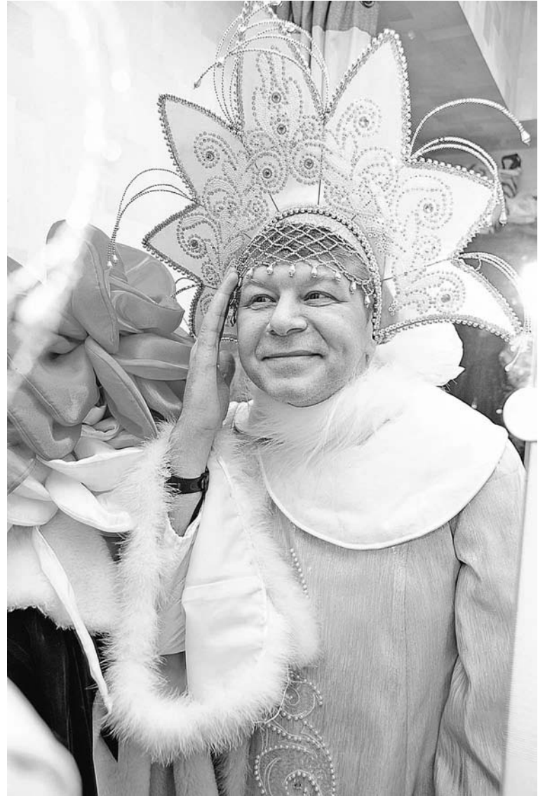
«Кто скажет, что я не Снегурочка, пусть бросит в меня снежок!»