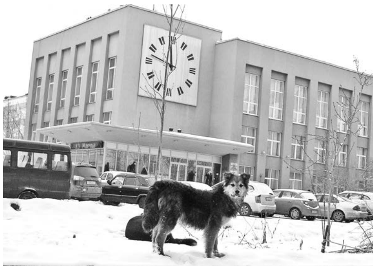
Кажущиеся милыми собаки - известные переносчики болезней, опасных для сородичей и людей.

размножаться, но собак сейчас такое количество, которое сойдет на нет только через годы, а жить нормально без страха за детей, себя, свое здоровье хочется уже сейчас.