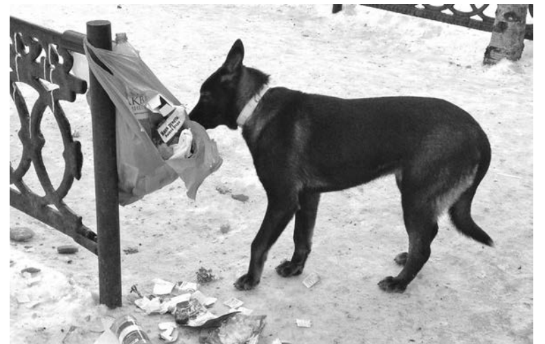
Иллюстрацию бессознательного содействия размножению собак долго искать не пришлось – центр города, ул.Сафонова.

Судя по количеству собачьих свор, в Североморске им живется сытно. Во-первых, организация сбора отходов во флотской столице, как и по всей стране в целом, далека от совершенства. Мало того, что мы не сортируем мусор (пищевые отходы, бытовые и т.д.), так еще и контейнеры не оборудованы крышками, как во всех европейских странах. Так что собакам всегда есть чем поживиться. Во-вторых, сердобольных жителей, подкармливающих животных, предостаточно. На ул.Корттик, например, гостинцы собачкам носят и взрослые, и дети.