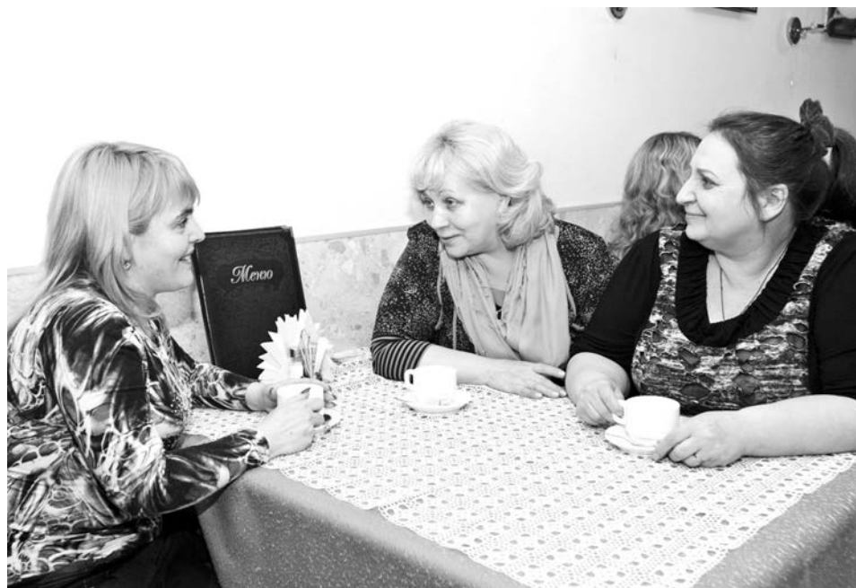
И пусть в 90-е было не просто – сегодня так приятно встретиться и вспомнить, как все начиналось.

Чтобы предоставить покупателю выбор, но не абы что, а качественную продукцию, пришлось преодолеть немало трудностей, набить массу шишек. Было время, когда