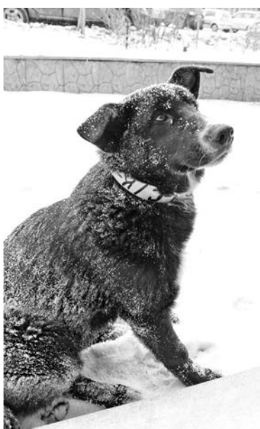
Собака в белом ошейнике стерилизована и здорова - почему бы ее не приютить у себя дома?!

— Одна только стерилизация — не мера. Есть исследования, показавшие, что в городе, где началась поголовная стерилизация собак, а кормовая база скудна, суки начнут приносить приплоды чаще, а количество щенков будет увеличиваться — так сама природа восполняет баланс. Кроме того, стерилизации и кастрации не снимают агрессивности, если собака до операции была злой, кидалась на людей. Операции имеют смысл, если затем собаки будут жить при предприятиях, как те же охранники, а люди станут за ними следить. Стерилизовать и затем выпускать псов в среду обитания — да, гуманно в отношении животных, но опасно для людей. Собака, единожды укусившая человека, особенно ребенка, испытывая власть, второго шанса не имеет, ее необходимо усыплять. А основной упор нужно делать на стерилиза-