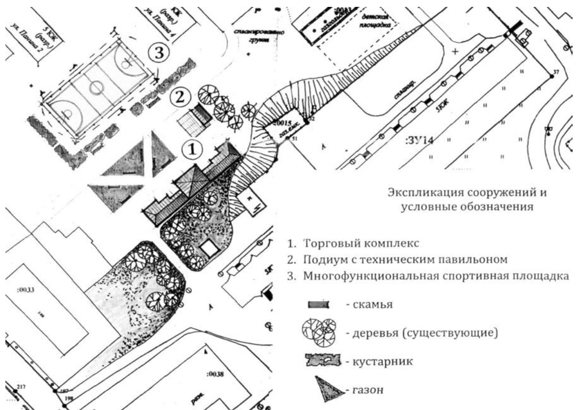
Экспликация сооружений и условные обозначения

По сути, дальнейшая судьба сафоновских предпринимателей находится в их руках. Чтобы сохранить рабочие места, им нужно выиграть торги на право