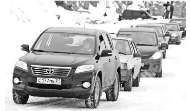
По ледовой трассе девушки двигались, как по подиуму: красиво и гордо.

– Я не хочу никому ничего доказывать, просто люблю погонять, а тут такая возможность. Вчера я узнала, что и в Североморске есть подобная трасса, с такими же крутыми поворотами, такая же скользкая. Теперь буду почаще туда выезжать и для собственного удовольствия, и для опыта, который мне