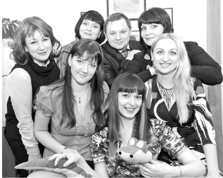
И в эфире, и в коллективе сотрудники нашего радио следуют своему корпоративному девизу: «Север-FM» - с нами не холодно!».