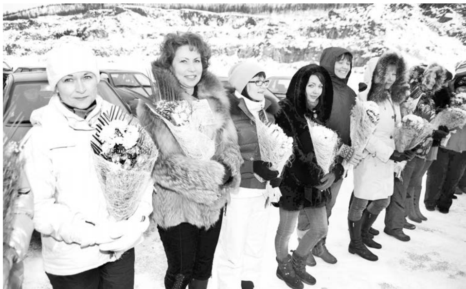
Цветы и памятные подарки получили все участницы гонок «Автоледи».