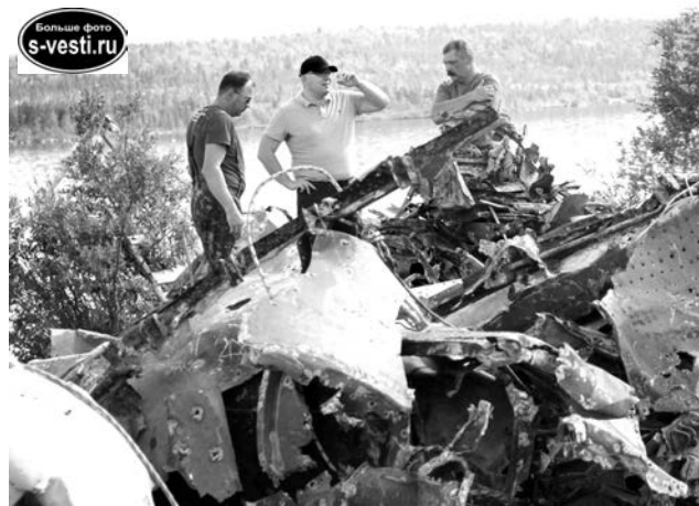
Обломки самолета произвели такое впечатление на Владимира Евменкова (в центре), что он отправился на лодке к месту падения.