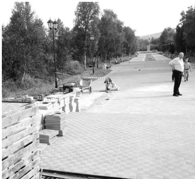
Укладка плитки на входной группе городского парка.