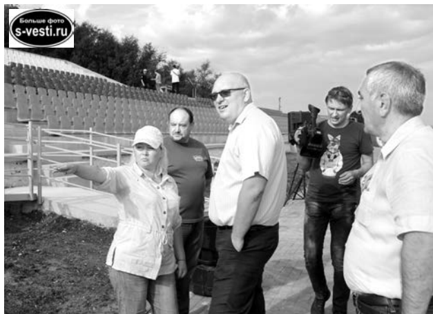
Реконструкция трибуны завершена, осталось внешнее благоустройство.

В глубине парка готовы места для устройства спортивных площадок, большой и малой. Заасфальтирована основа, проложены плиточные дорожки, подведено электриче-