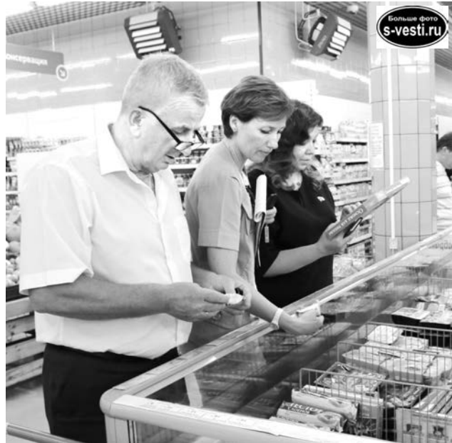
«Народному контролю» подверглись разные категории товаров.

В прошлом номере мы уже писали о работе поисковиков из Татарстана, достающих со дна озера Среднее Ваенгское обломки пикирующего бомбардировщика Пе-2, потерпевшего крушение во время учебного бомбометания 14 августа 1942 года.