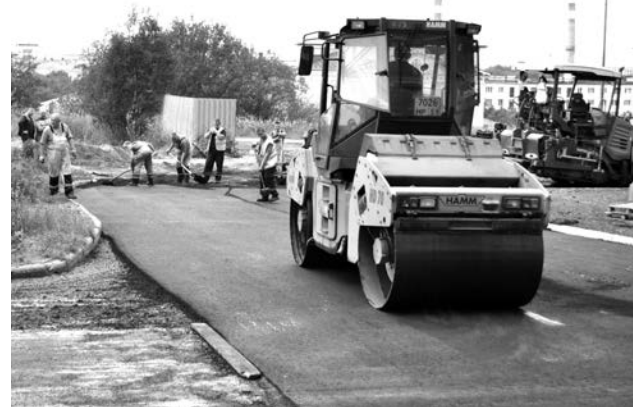
Качественной укладке асфальта способствует хорошая погода.

зяйства администрации ЗАТО г. Североморск. Теперь с нетерпением ждем окончания работ, и на этом мы не остановимся: хотим еще привести в порядок зеленый участок во дворе, засеять его газонной травой, высадить цветущие кустарники, уже выкосили двухметровую крапиву и бурьян, ближе к осени нам обещали завезти грунт. На следующий год наш дом попал в программу капремонта, где основной работой будет перекрытие кровли.