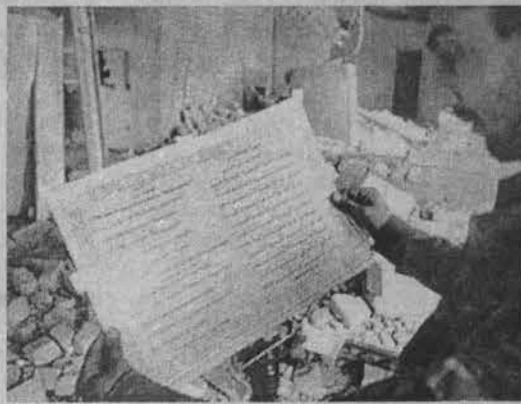
Экстремисты умело сочетают террор и идеологическую обработку.

В отличие от большинства азербайджанцев экстремисты, обосновавшиеся в республике, не ощущают недостатка в деньгах. Зафиксированы неоднократные переводы финансовых средств через Бейрут из Саудовской Аравии на счета этих лагерей. Главным проводником денег выступает банк саудовского шейха Салеа Абдаллы Камеля «Альбарак банк Лебанон». В 1997 году он уже финансировал арабов, воевавших на стороне талибов в Афганистане. Первый перевод для азербайджанских баз был сделан в конце сентября в размере 2 миллионов долларов. Получил деньги гражданин Объединенных Арабских Эмиратов бен Абделла, направившийся с ними в Чечню. 5 октября азербайджанскими по-