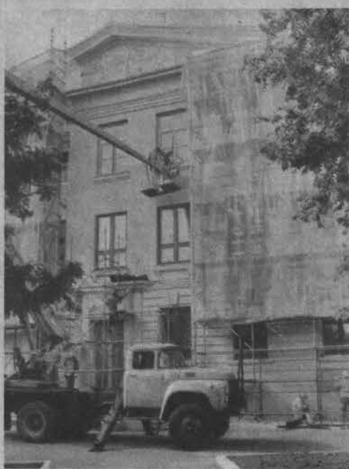
Дом творчества в лесах.

В школе № 5 поселка Сафоново-1 давно уже требовалось обновить кровлю. В прошлом году пытались частично латать дыры, но безрезультатно. Этим летом старая кровля будет полно-