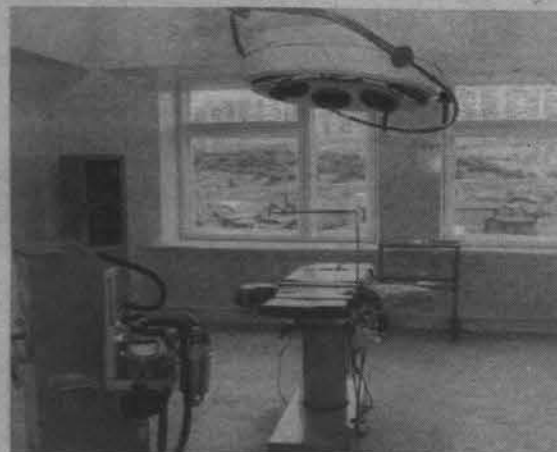
Операционный блок в ЦРБ.